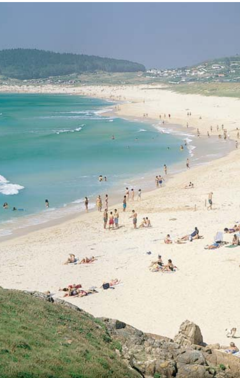
As praias do norte (Covas, San Xurxo, Doniños, Ponzos) son amplas e moi concorridas por bañistas e surfeiros.

Pola contra, é historia da verdadeira a que lle sucedeu a lord Abercrombie. Nesta longa praia de dous quilómetros desembarcaron trece mil homes ao seu mando coa intención de tomar o castelo de San Felipe e a cidade pola retagarda. A praza estaba desgornecida, pero a estratexia dos escasos defensores conseguiu acantear os ingleses no monte de Brión e derrotalos nun combate que aínda hoxe se festexa na cidade.