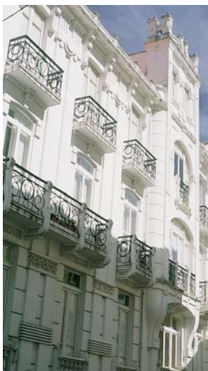
As casas da Magdalena son unha homenaxe viva á máxima achega galega á arquitectura do XX: as casas de galería.

mente ao levar algúns anos pechado ao público, pero no exterior aínda presenta o porte do pasado. O interior e a parte dereita da fachada foron deseñados polo arquitecto Riva de Soto (1892), mentres que o lado esquerdo é obra posterior, moito máis lucida, de Ucha (1921).