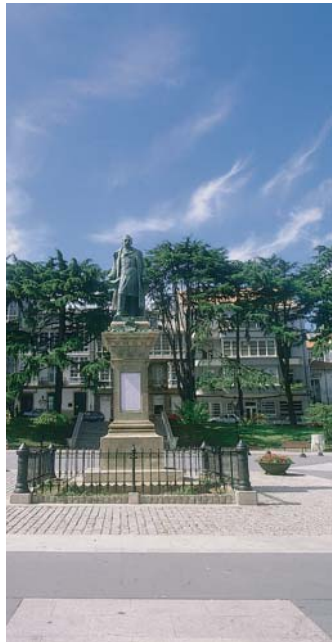
Praza e estatua do Marquês de Amboaxe, no barrio da Magdalena.

A segunda semana de xullo, no recinto feiral da Malata. Certame de industria e de servizos, que se realiza dende 1953. A máis importante de Galicia. O recinto feiral organiza, ademais, outros interesantes certames específicos ao longo do ano.