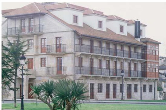
A casa do Patín, curioso vestixio da antiga planificación do barrio de Esteiro, agora dedicada á biblioteca universitaria.

A construción do estaleiro atraerá gran cantidade de man de obra, que comezará a vivir no Esteiro, proxecto cuadrulado do primeiro barrio obreiro de Galicia. Quedan algúns vestixios del, como a moi singular Casa do Patín , convertida en biblioteca, e