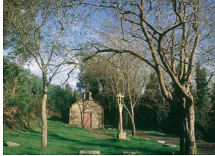
Os montes que rodean Ferrol son catálogo de vistas e recantos deliciosos, como a capela de Chamorro ou esta ermida de San Cristovo.